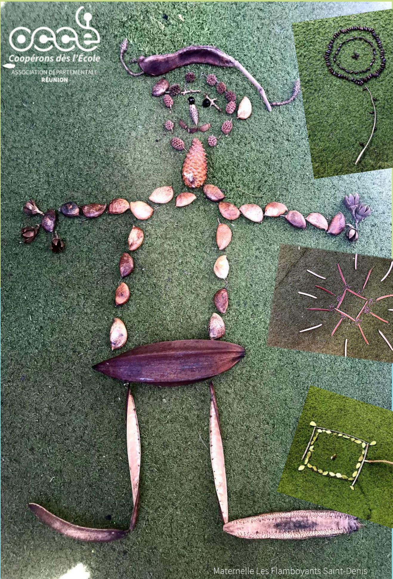
Maternelle Les Flamboyants Saint-Denis