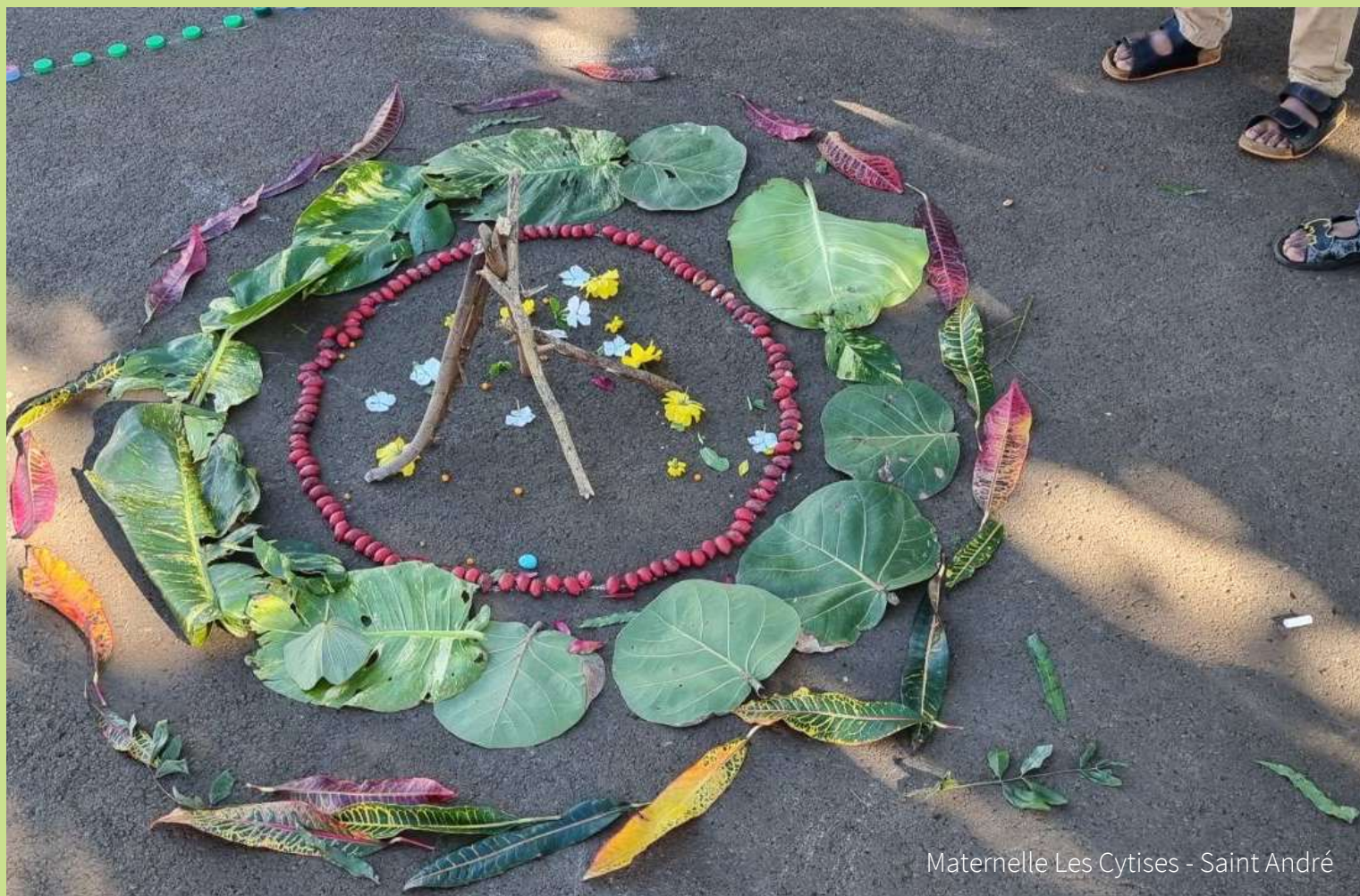
Maternelle Les Cytises - Saint André