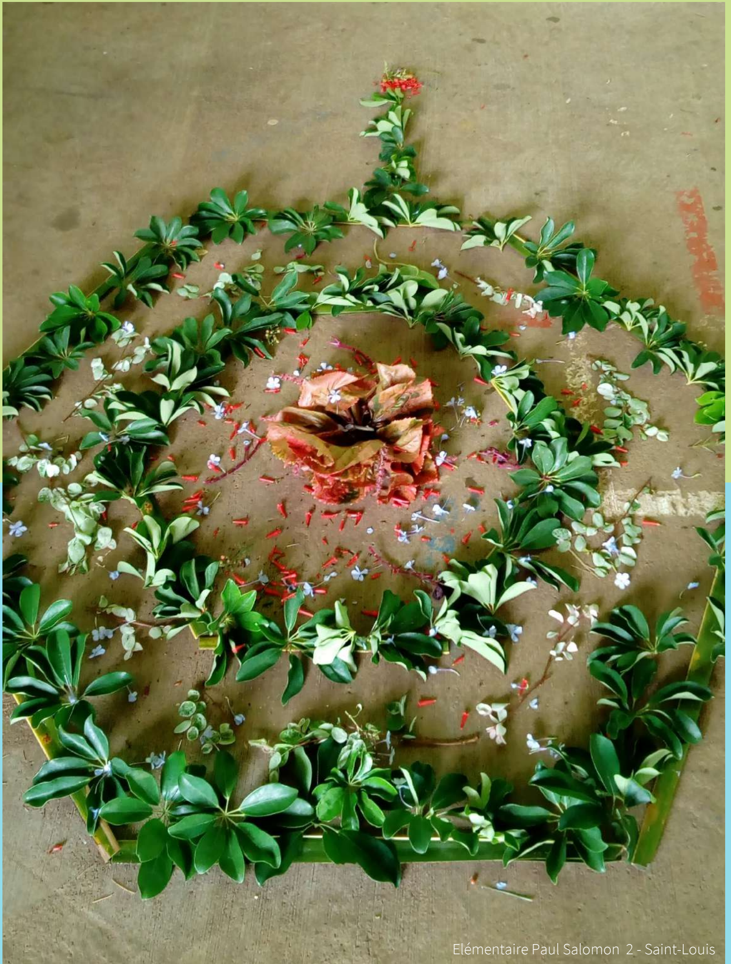
Elémentaire Paul Salomon 2 - Saint-Louis