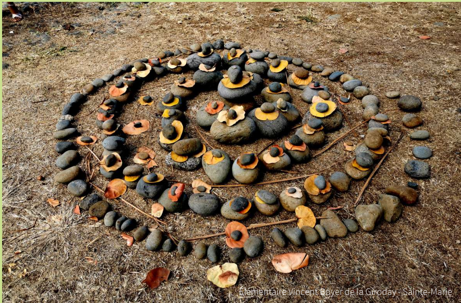
Élémentaire Vincent Boyer de la Giroday - Sainte-Marie