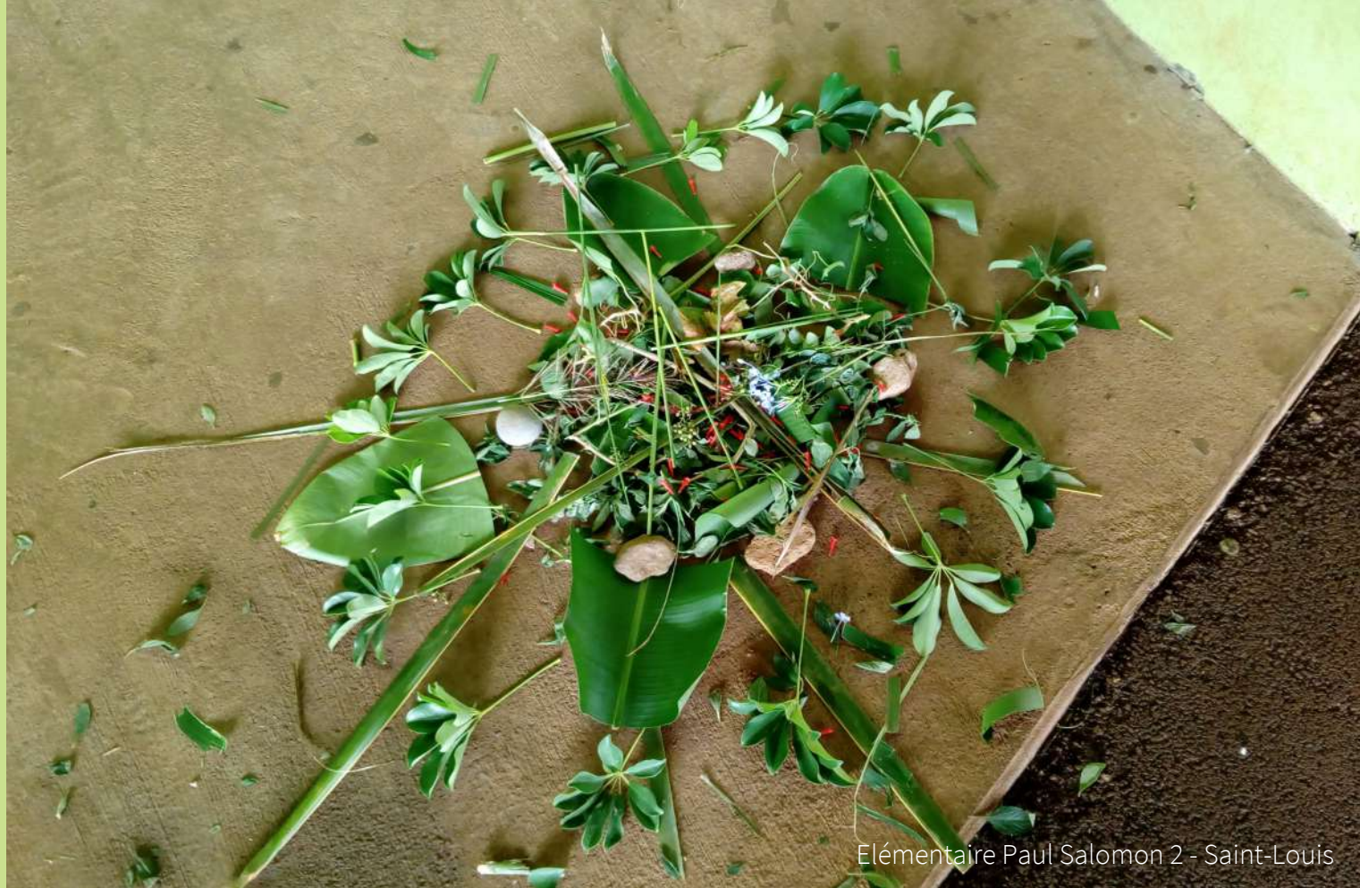
Elémentaire Paul Salomon 2 - Saint-Louis