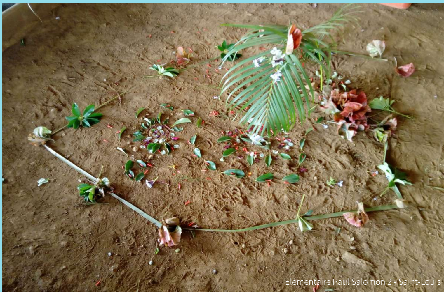
Elémentaire Paul Salomon 2 - Saint-Louis