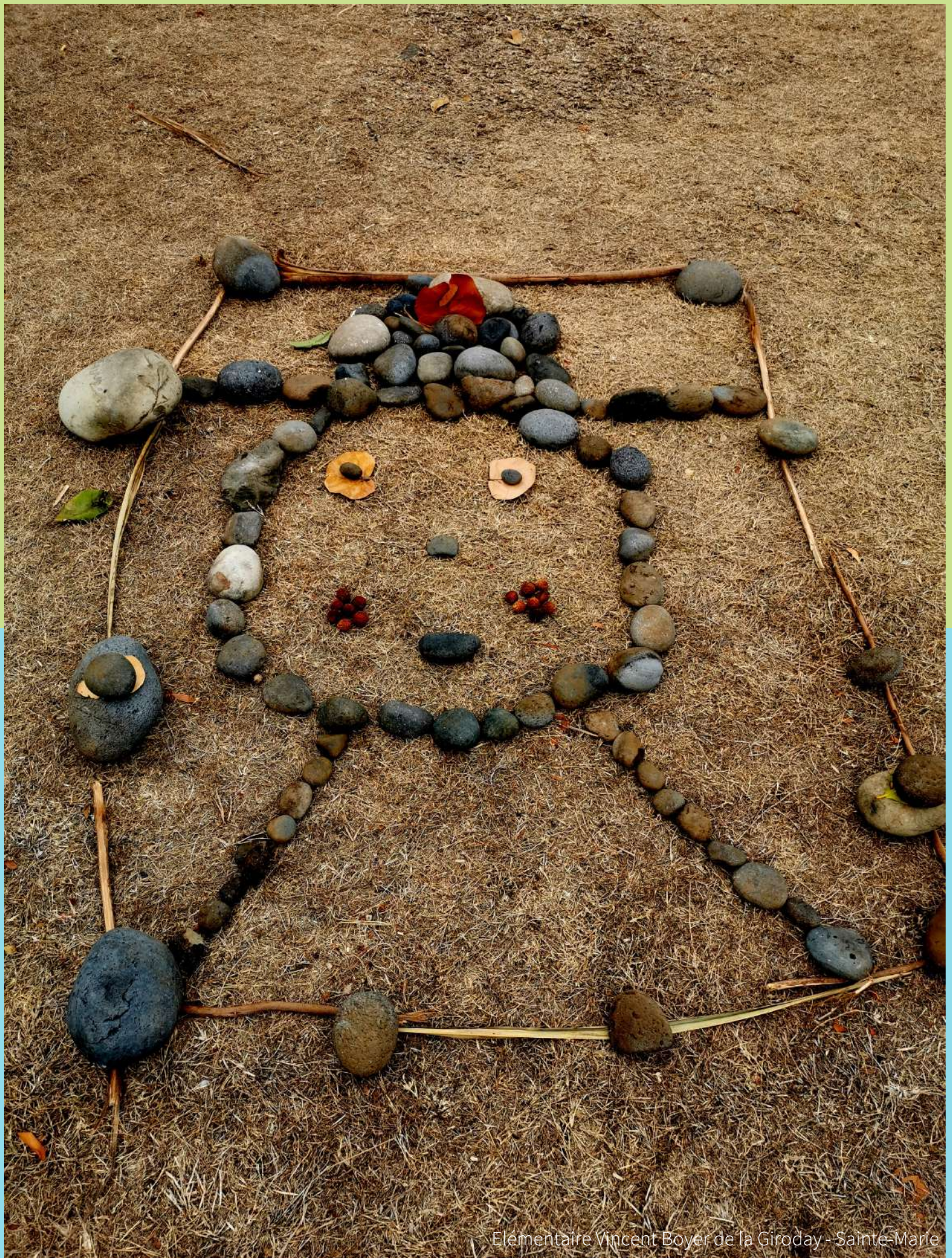
Elementaire Vincent Boyer de la Giroday - Sainte-Marie