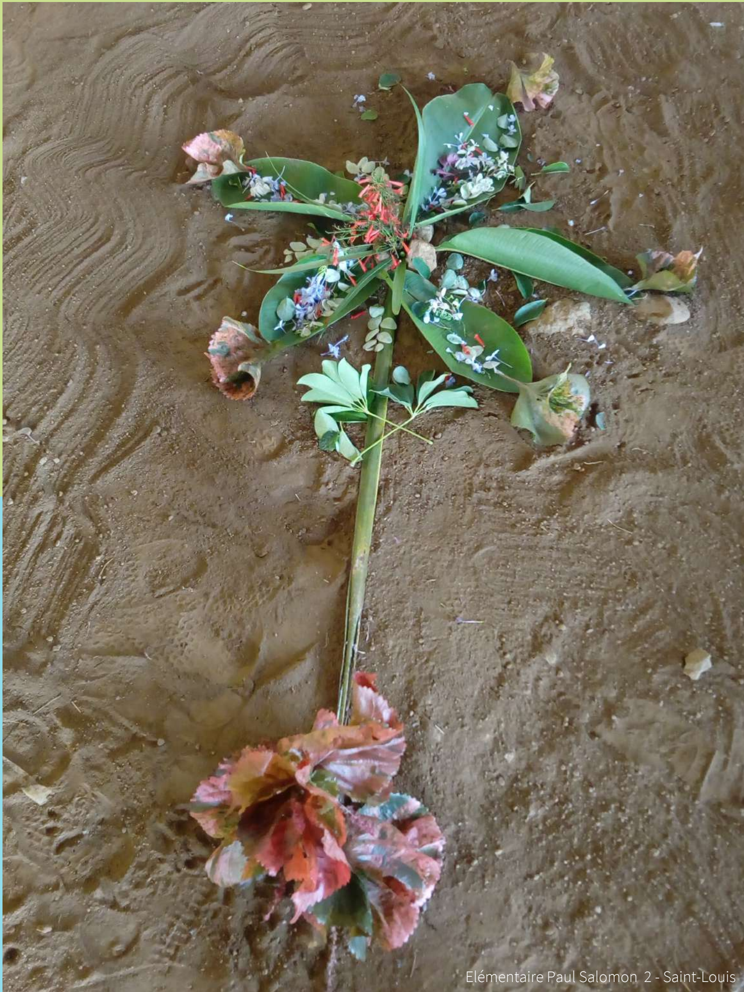
Elémentaire Paul Salomon 2 - Saint-Louis