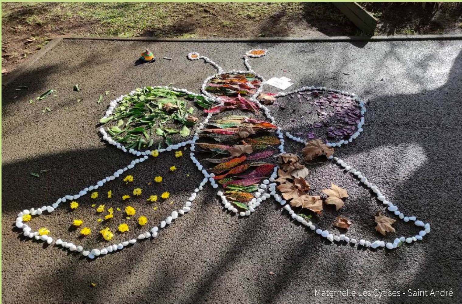
Maternelle Les Cytises - Saint André