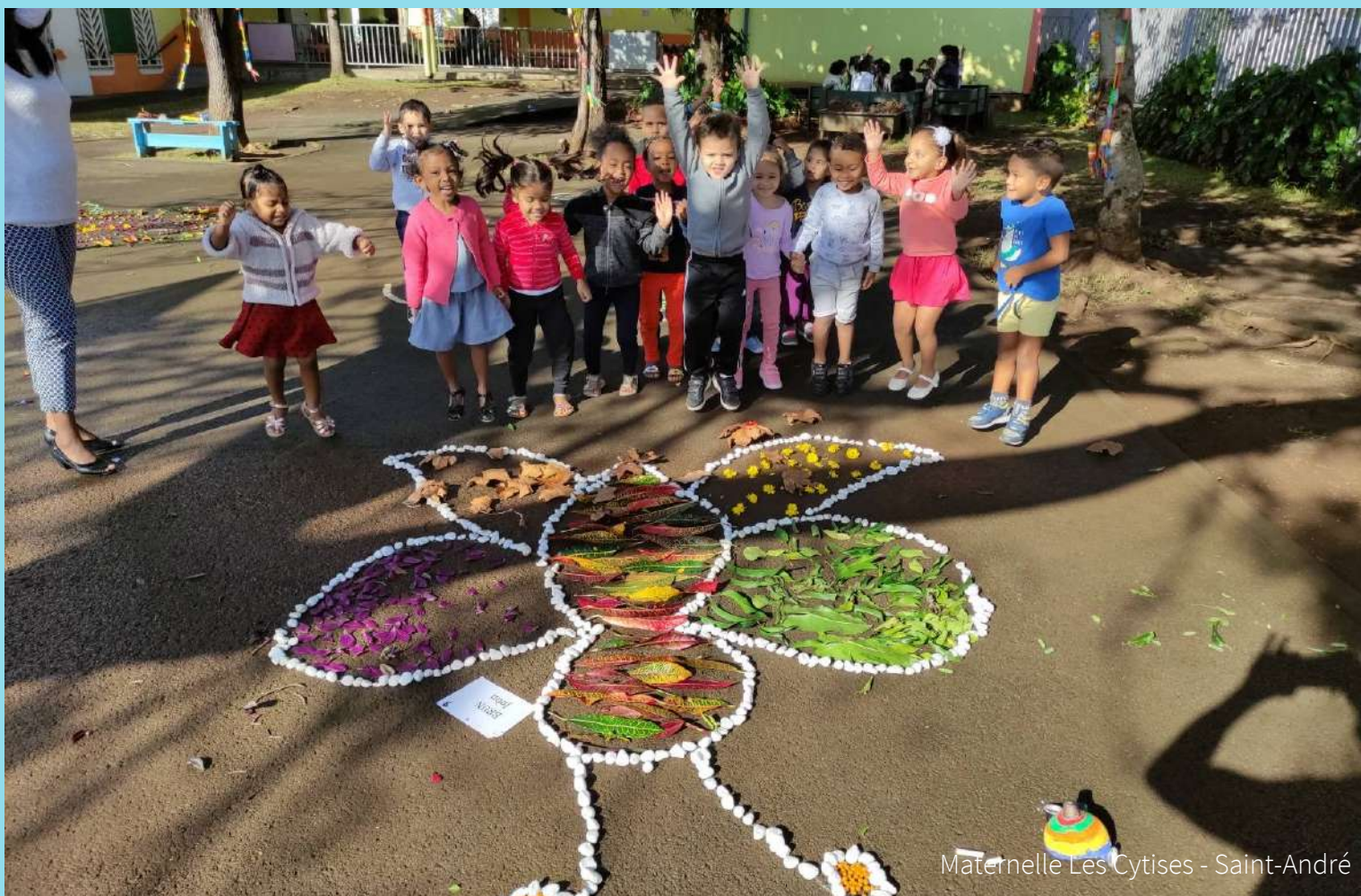
Maternelle Les Cytises - Saint-André