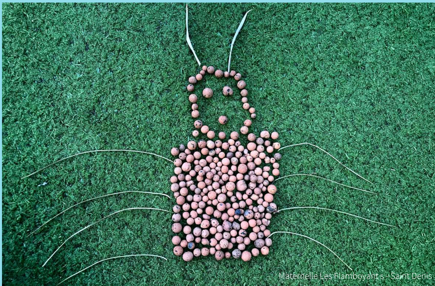
Maternelle Les Flamboyants - Saint Denis