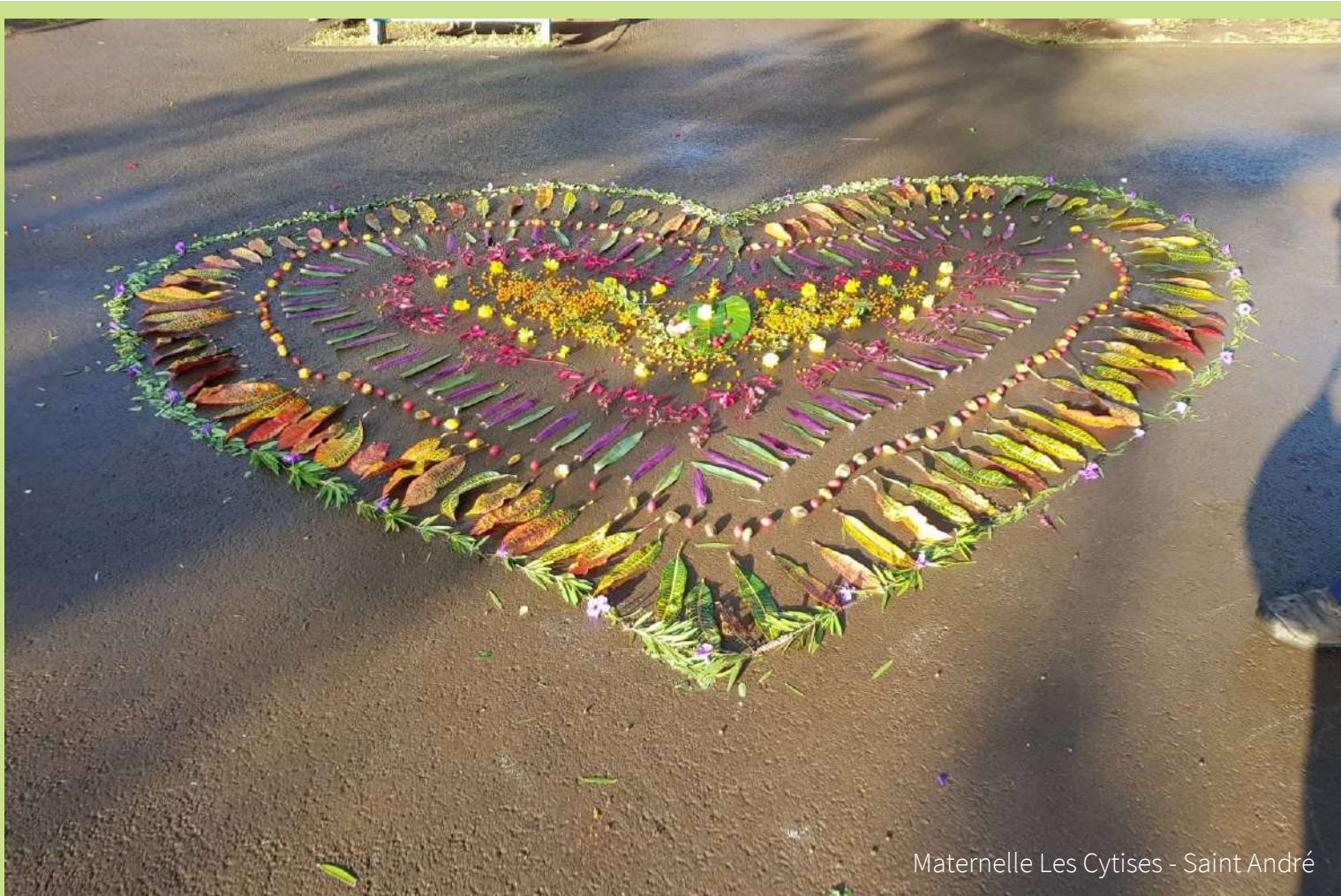
Maternelle Les Cytises - Saint André