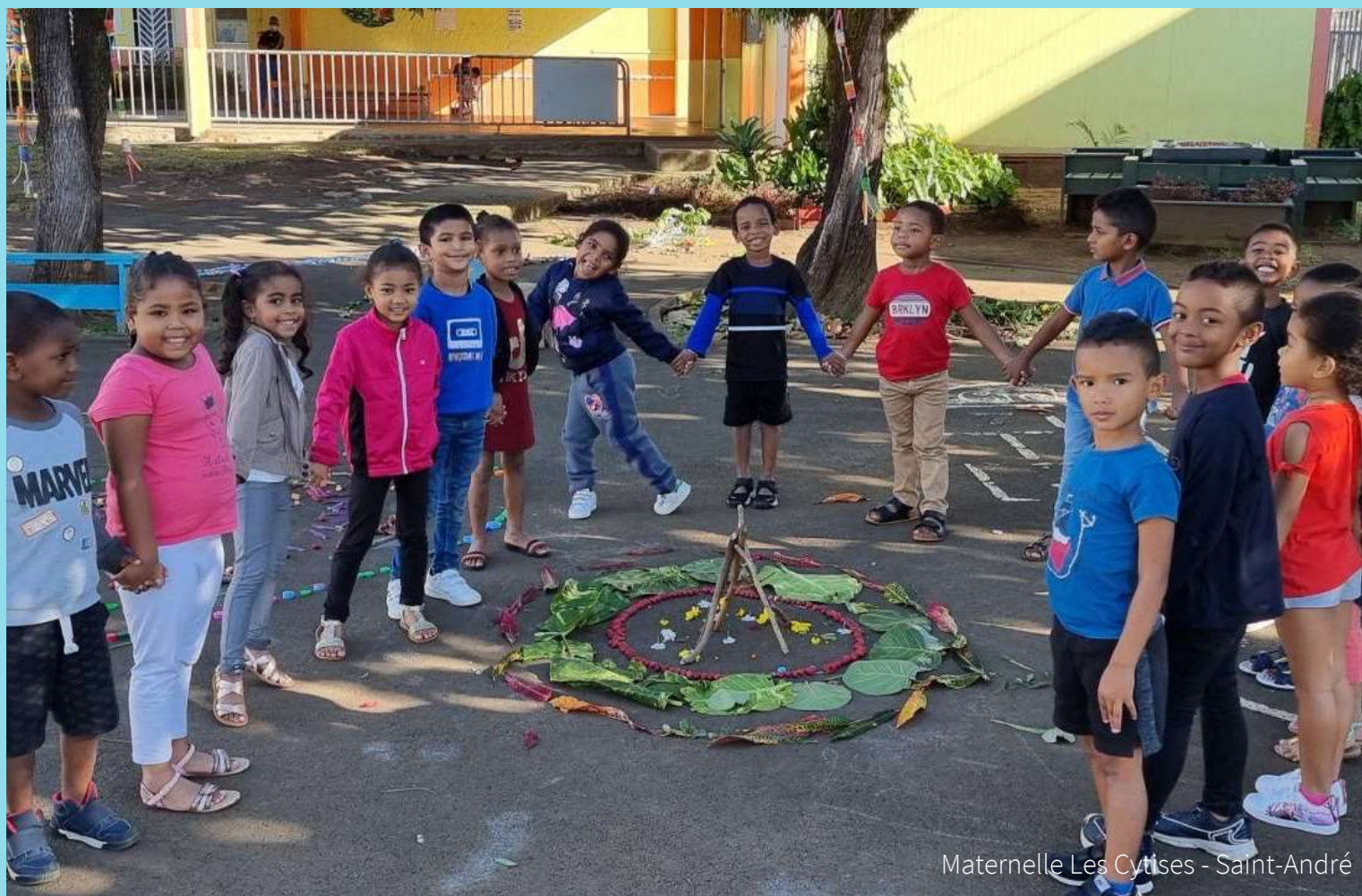
Maternelle Les Cytises - Saint-André