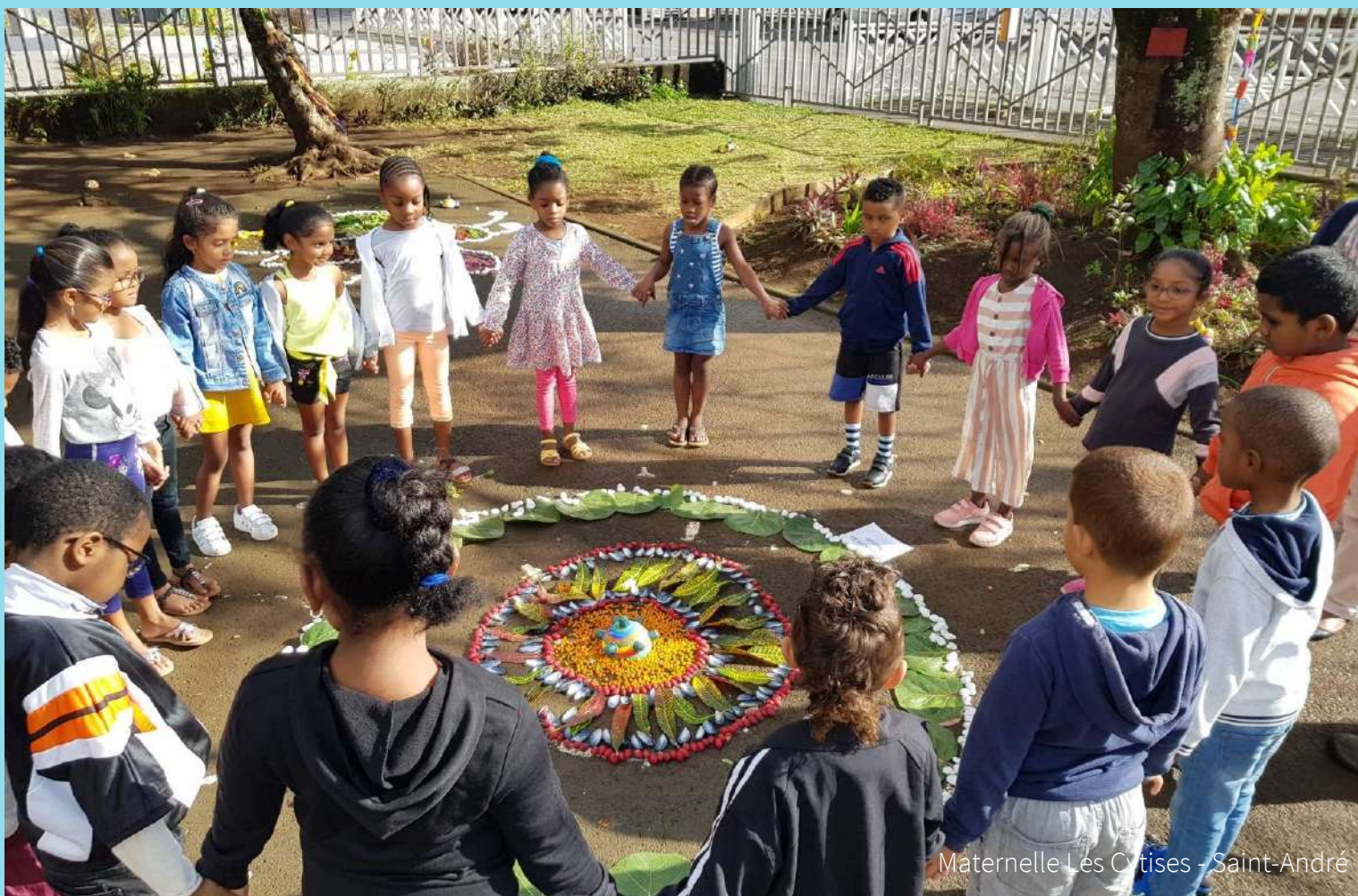
Maternelle Les Cytises - Saint-André