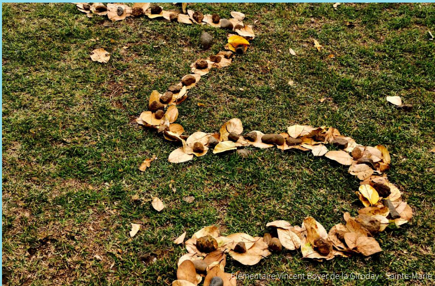
Élémentaire Vincent Boyer de la Giroday - Sainte-Marie