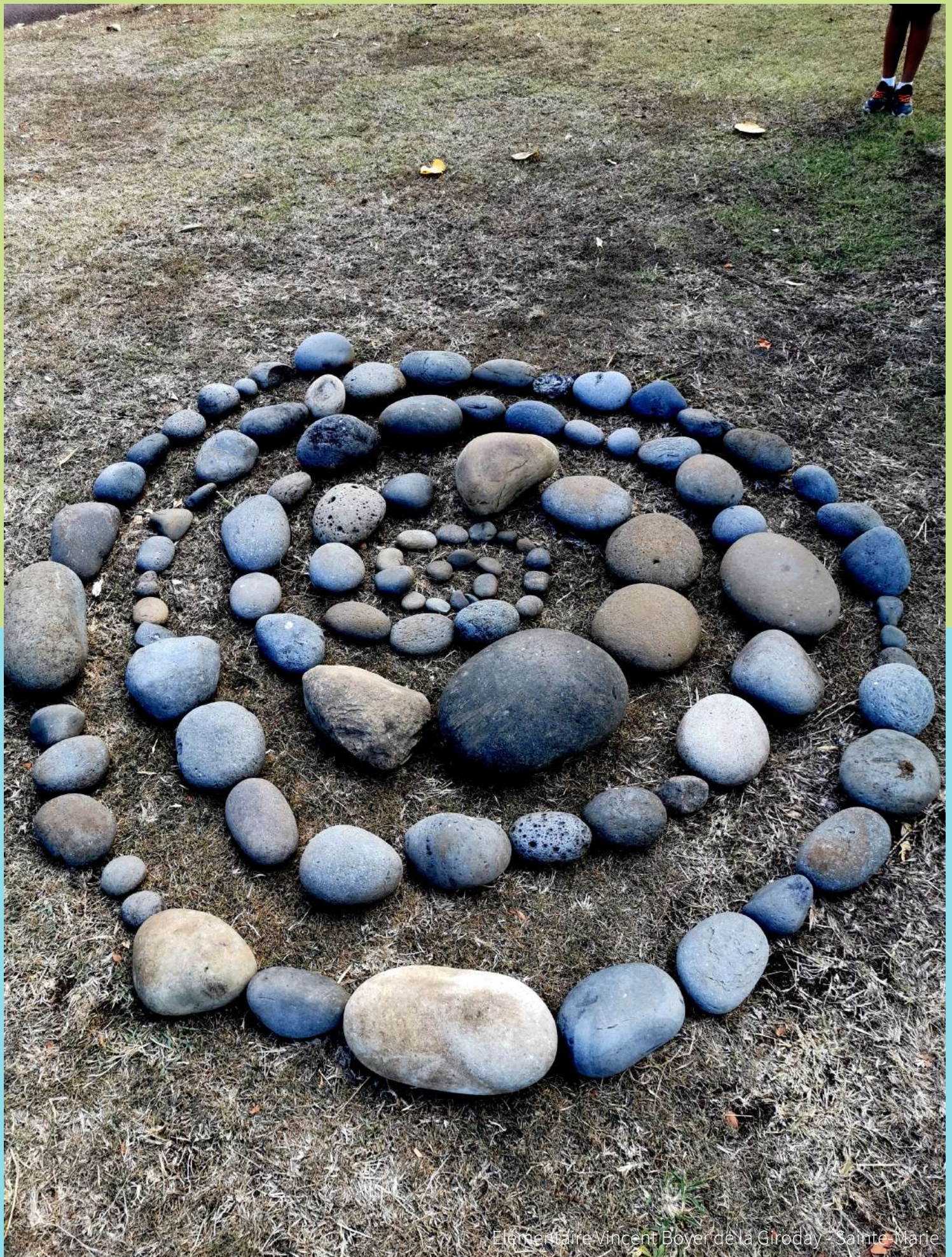
Elémentaire Vincent Boyer de la Giroday - Sainte-Marie