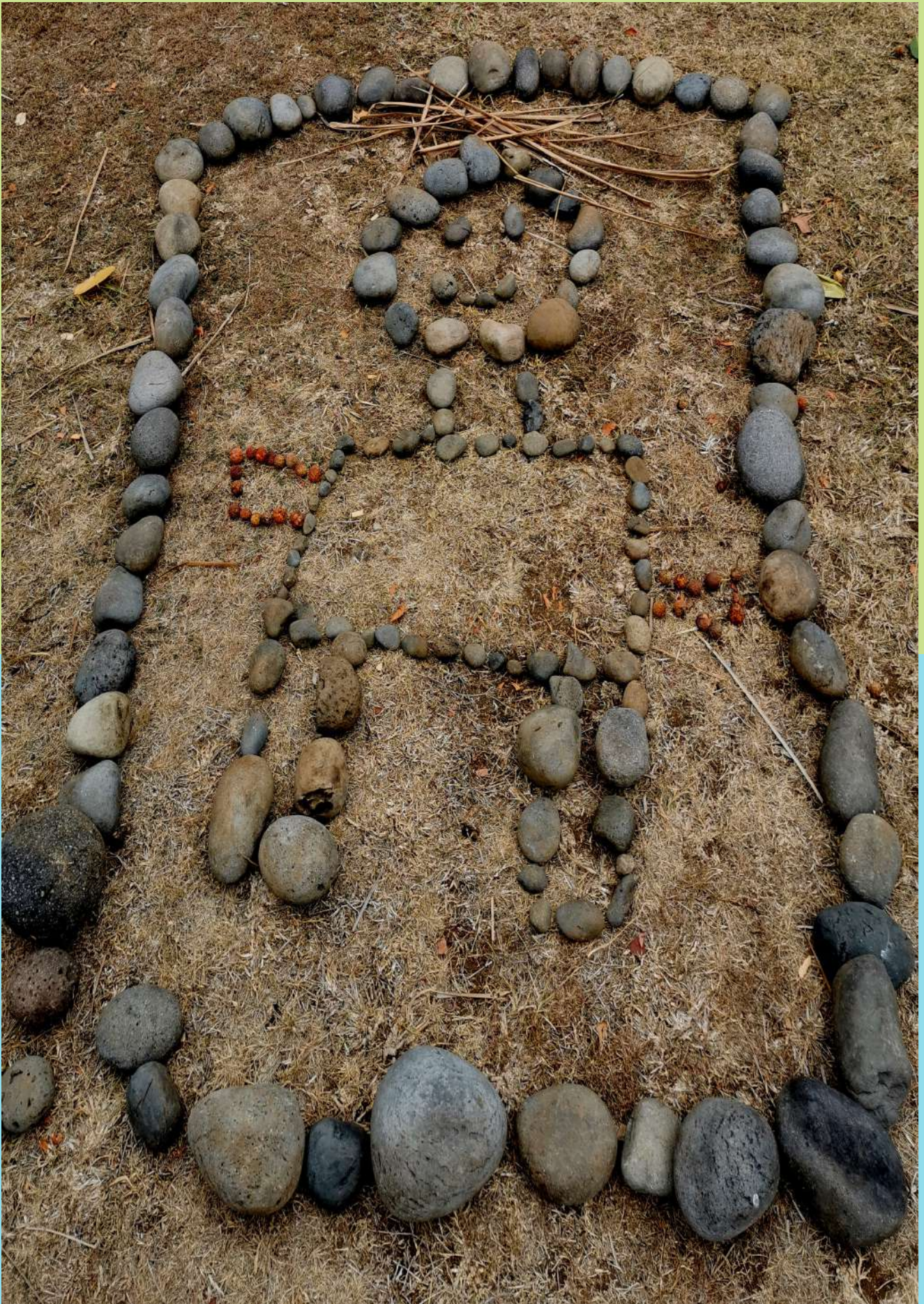
Elémentaire Vincent Boyer de la Giroday - Sainte-Marie