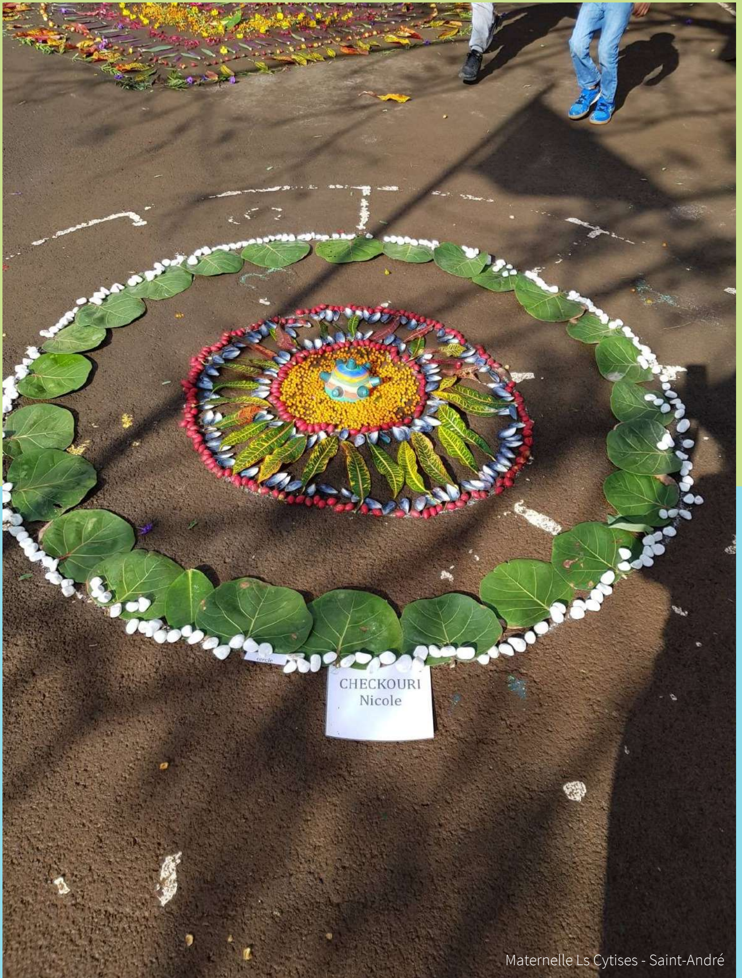
Maternelle Ls Cytises - Saint-André