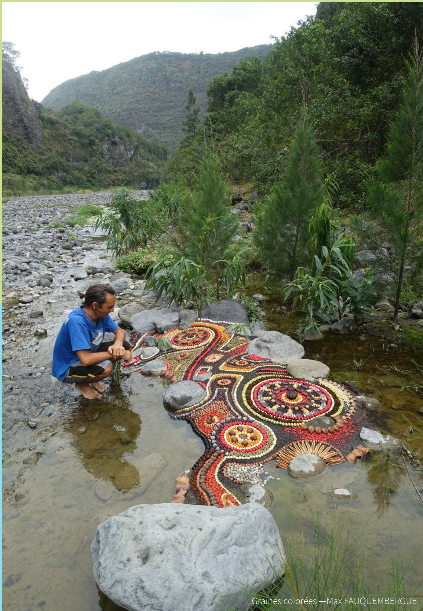
Graines colorées —Max FAUQUEMBERGUE