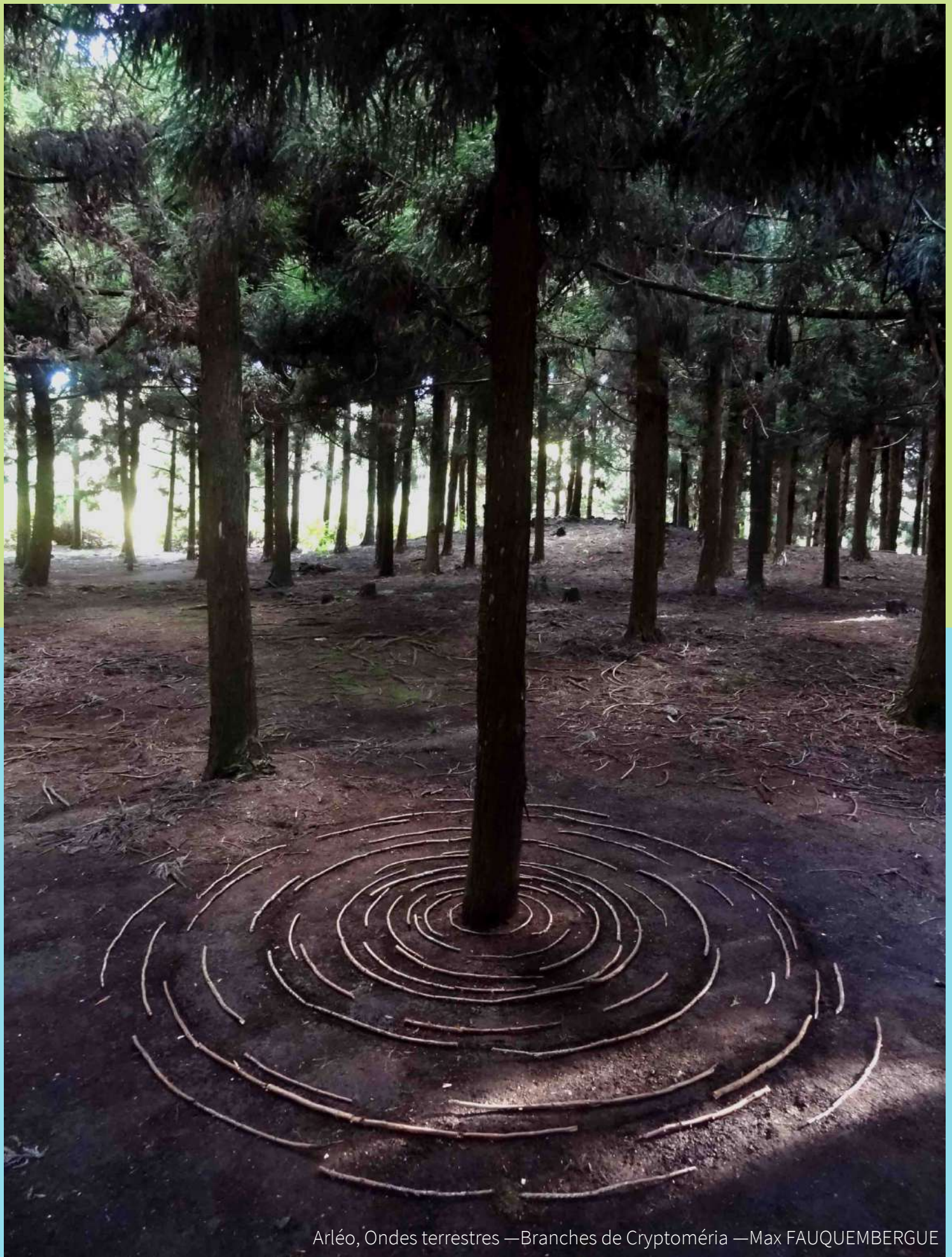
Arléo, Ondes terrestres —Branches de Cryptoméria —Max FAUQUEMBERGUE