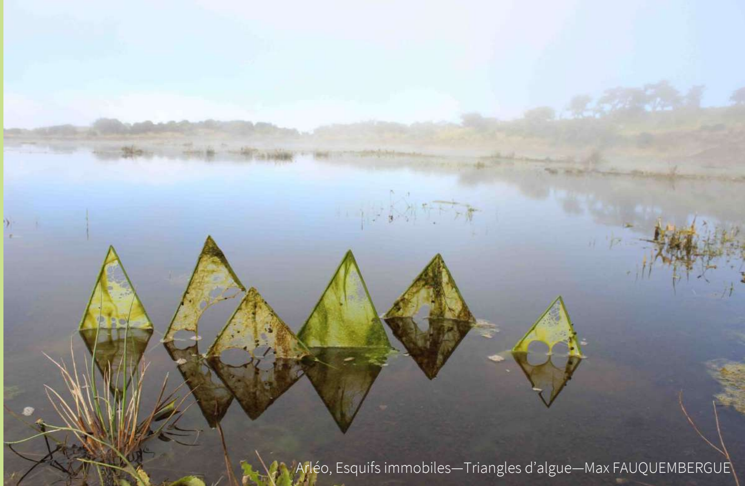
Arléo, Esquifs immobiles—Triangles d'algue—Max FAUQUEMBERGUE