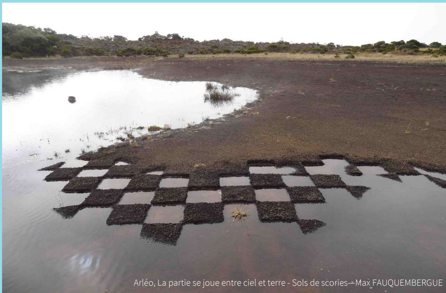
Arléo, La partie se joue entre ciel et terre - Sols de scories—Max FAUQUEMBERGUE