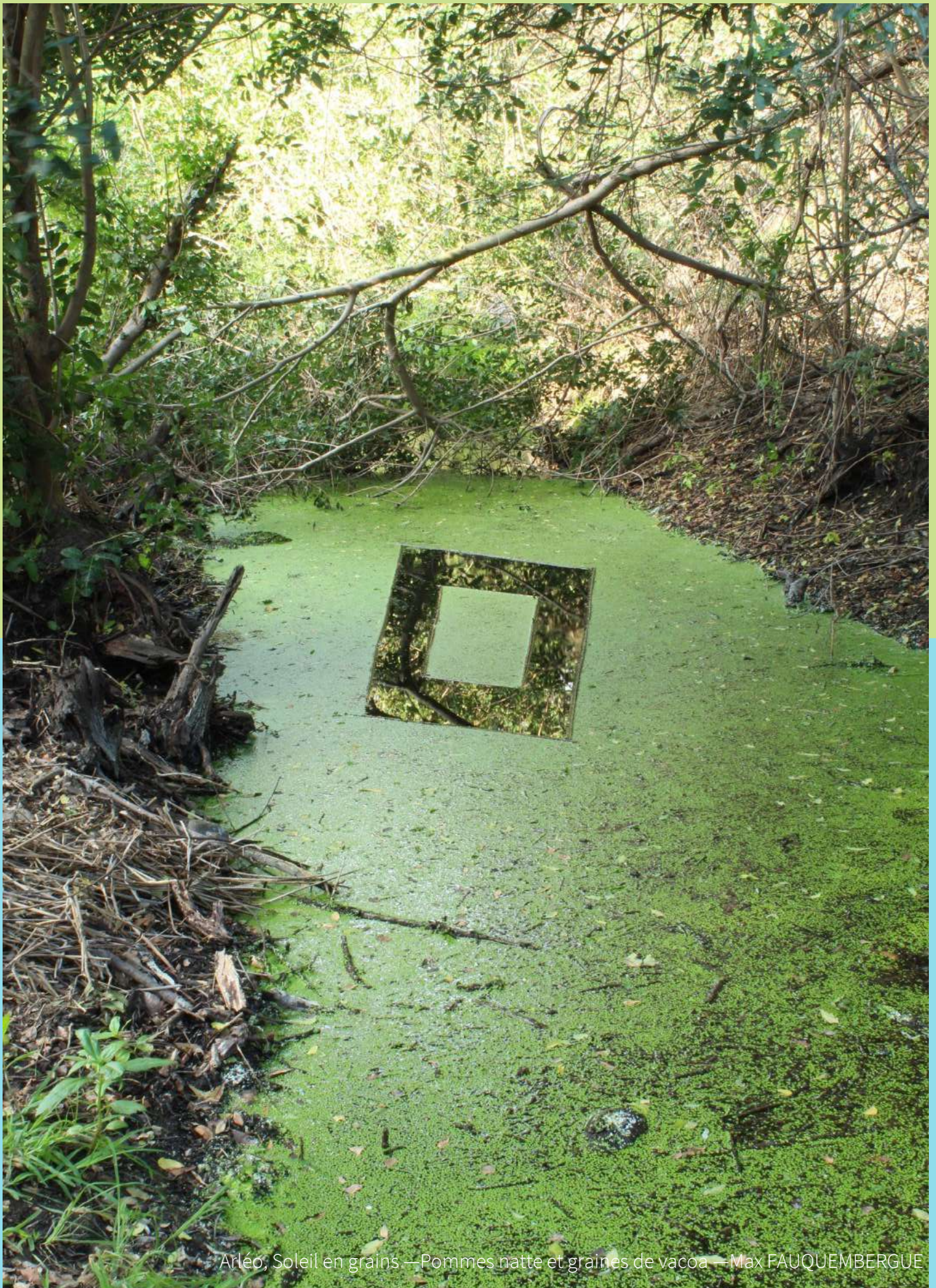
Arléo; Soleil en grains —Pommes natte et graines de vacoa — Max FAUQUEMBERGUE