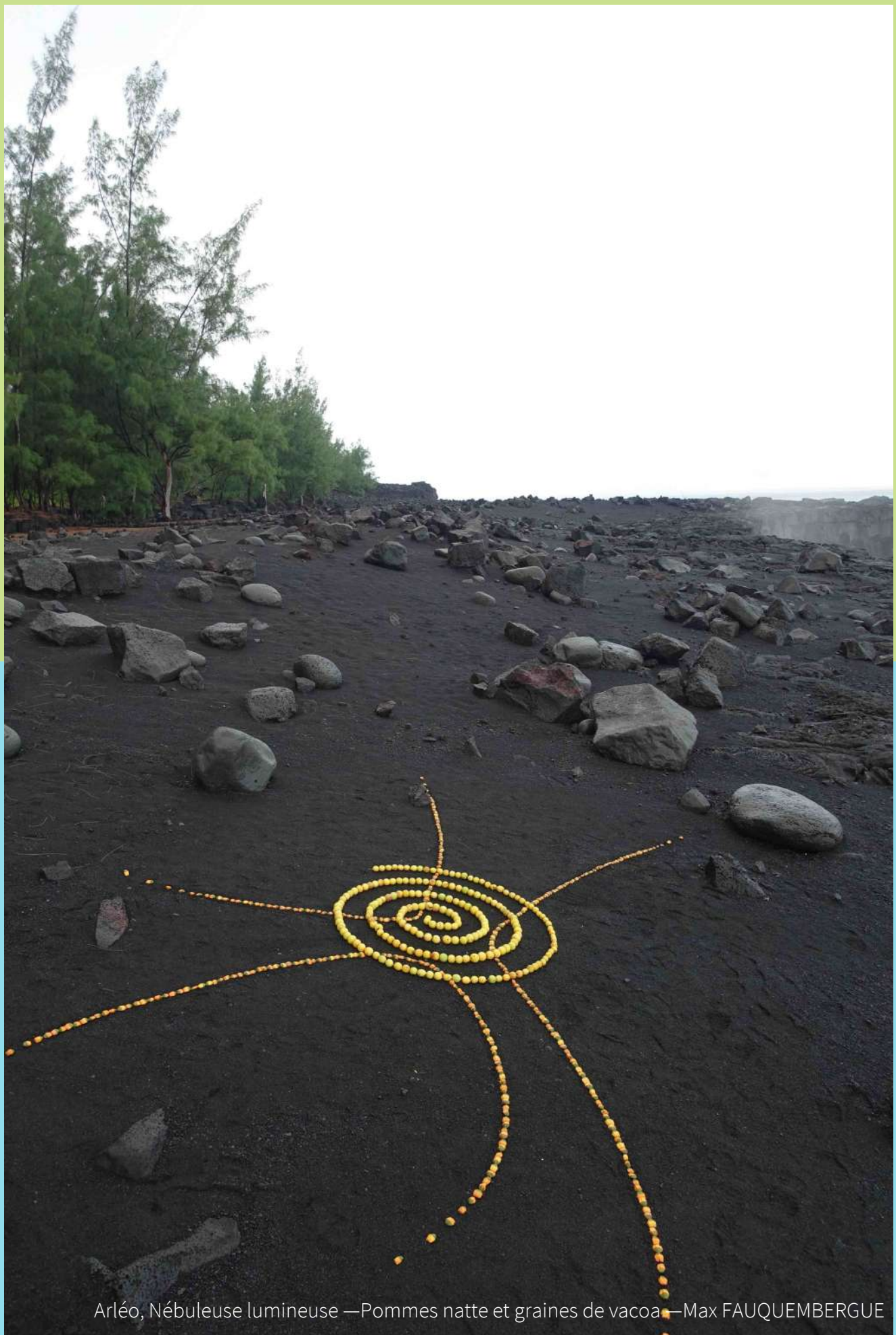
Arléo, Nébuleuse lumineuse —Pommes natte et graines de vacoa—Max FAUQUEMBERGUE